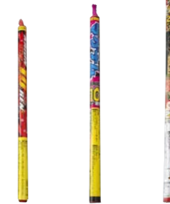
固定の必要があるもの