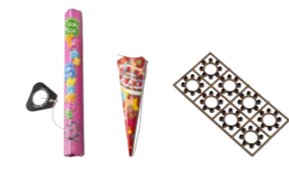
パーティークラッカー、平玉等